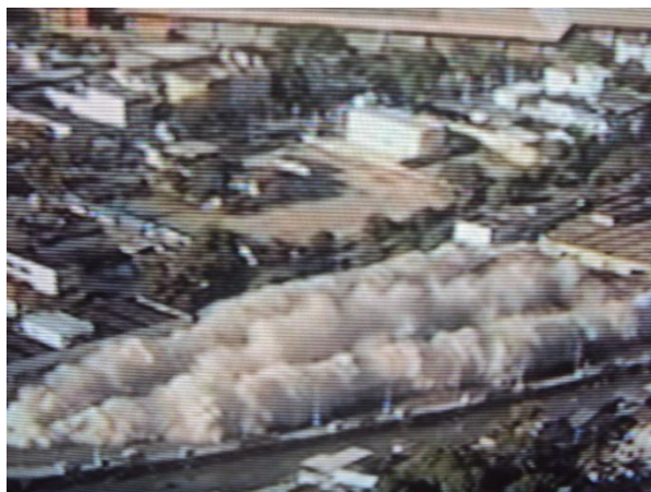
Foto 5: Demolição do Terminal do Canal na subárea 5 (2012)

Fica bastante claro ante as mudanças no bairro da Pavuna aqui apresentadas, que tais transformações ocorreram prioritariamente para atender à dinâmica gerada pela presença do transporte metroviário ou em decorrência desta, tendo sua configuração influenciada em grande parte por esta variável.