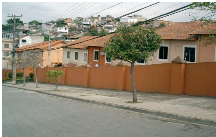
Foto 7: Condomínio construído em antigo terreno próximo à estação do metrô (2005).

O mercado imobiliário também deixou suas marcas nesse processo de reorganização do bairro. O exemplo mais explícito disso foi a construção de um condomínio de casas de porte médio, nas proximidades da atual estação do metrô, com valor acessível apenas para uma pequena parcela da população local (foto nº 7). Tal empreendimento se fez em uma área que se apresentava inutilizada por várias décadas. Na época do lançamento do condomínio a implantação do metrô no bairro era algo iminente, servindo este último como propaganda para o referido empreendimento imobiliário.