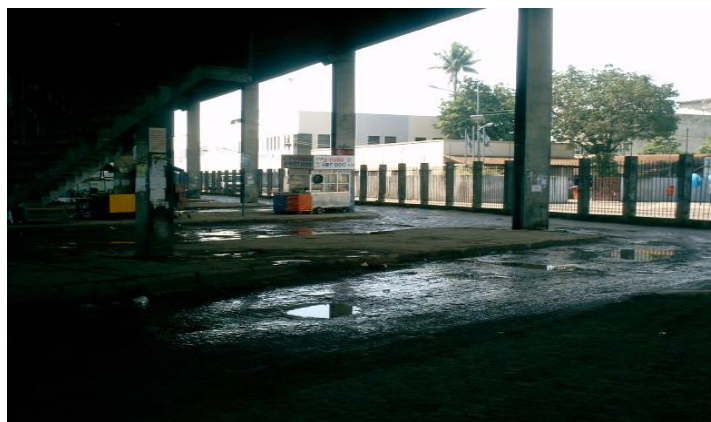
Foto 4: Precarização do antigo Terminal do Canal na subárea 5 (2005).