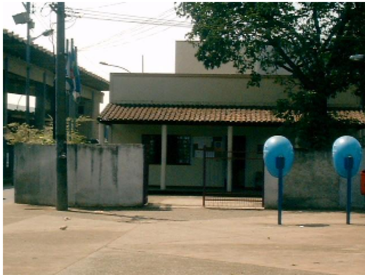
Foto 2: XXV RA na Praça Centenário da Pavuna na subárea 5 (2005).