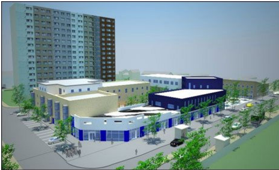
Figura 1: Loudon Square