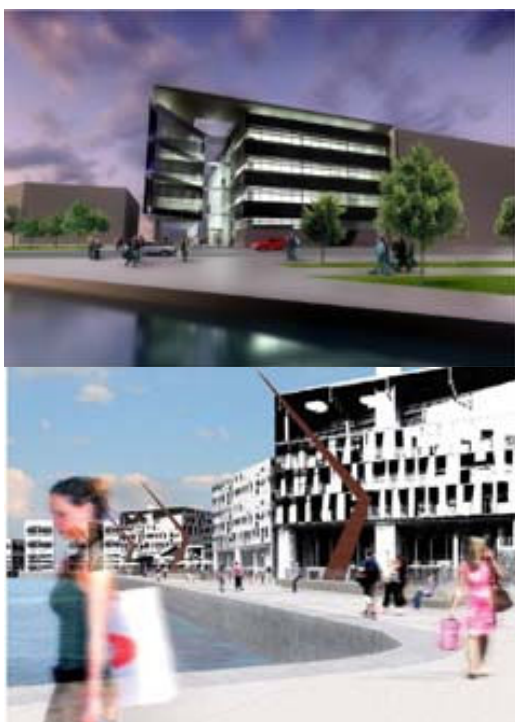
Figura 2: Porth Teigr